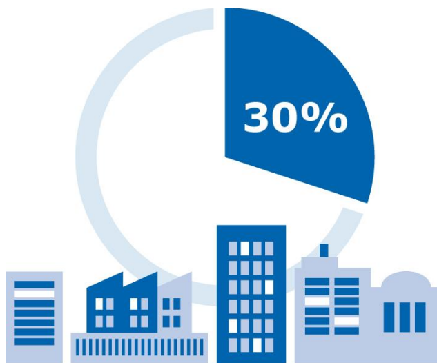
DLA DUŻYCH FIRM