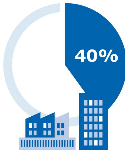
DLA ŚREDNICH FIRM